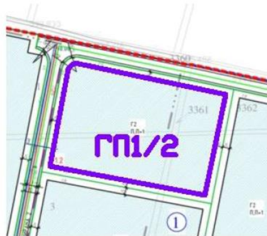
Градежни парцели 1.2–1.6